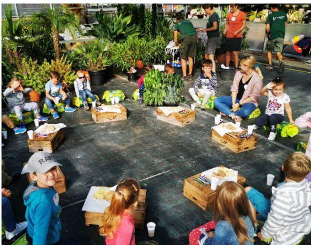
Auch ein Znüni wurde von der Gärtnerei gespendet.