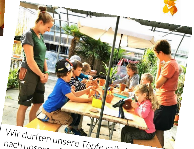
Wir durften unsere Töpfe selbst gestalten, nach unserem Thema: «Elmar»