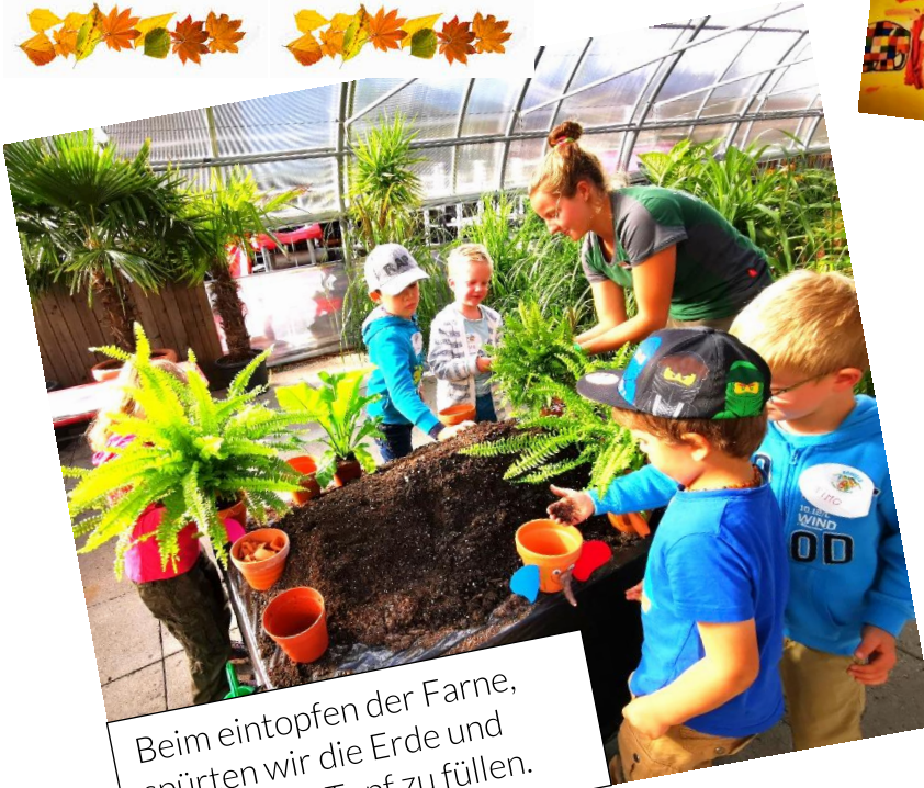
Beim eintopfen der Farne, spürten wir die Erde und lernten den Topf zu füllen.